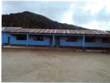
Foto1: Estado actual de lamina